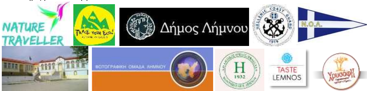
Δημοτικό Σχολείο Κοντοπουλίου Λήμνου

Με την υποστήριξη των συνεργατών 'MELTEMI':