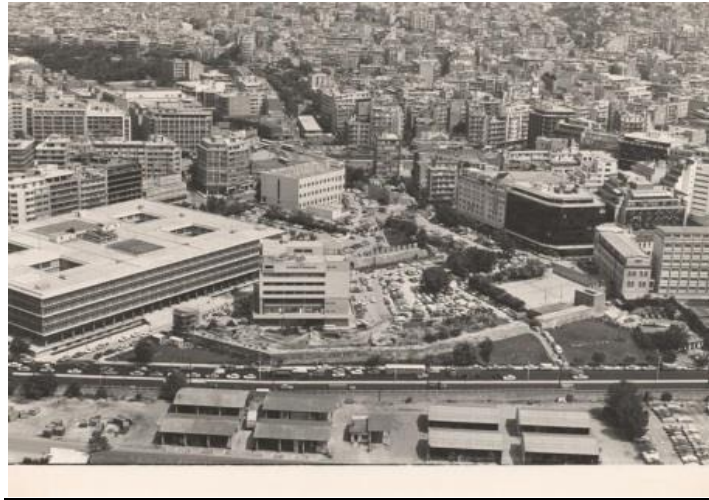
Πλατεία Βαρδαρίου / Δικαστήρια από ψηλά

«...Και ύστερα η Πλατεία, όπου όταν κάποτε συσπειρωμένος καταπλέεις σου φαίνεται ζοηρή, ορεξάτη, πολύ επίγεια, με τα πολυόμματα οχήματα, ταξί, λεωφορεία, ιδιωτικά, που εσύ προτιμάς να μην τα κοιτάζεις... Οι κρεμασμένες εφημερίδες σου επιτρέπουν μια στάση και κάποια ανασύνταξη, τα λαϊκά σινεμά, με τις φωτεινές επιγραφές επιμένουν στα φτηνά πια όσο και αχρείαστα τραβηχτικά κόλπα τους όπου παλιότερα, τα απογεύματα της Κυριακής πλήθη λαού, που έζεχναν, η αλήθεια, και λιγάκι, φύλαγαν ουρά με σπρωξίματα, γέλια και επεισόδια σποραδικά, ενώ οι φαντάροι και οι νεαροί χωρικοί διέρχονταν ομαδικά, τραβώντας με μυστηριώδη και ακατάδεχτα χαμόγελα για την οδό Βαλαωρίτου, που εκείνη κάθε άλλο παρά αριστοκρατική όπως η αθηναϊκή είναι, και εν γένει για τα Λαδάδικα. Αυτοί θα έρχονταν, αν έρχονταν, στο σινεμά αργότερα...».