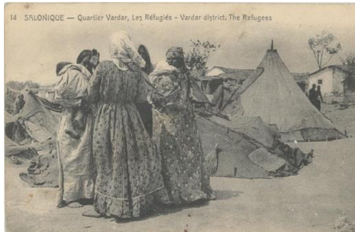
Πρόσφυγες στην περιοχή του Βαρδάρη

«...Μια νέα Avenue de la Base ανοίχτηκε από την προκυμαία κατευθείαν ως την Πύλη του Βαρδάρη, όπου η πρωτοφανής κυκλοφορία ελεγχόταν από Βρετανούς στρατονόμους. Πιο πέρα ήταν όλο υπαίθριοι πάγκοι εμπόρων, καφενεία και στρατιωτικές καντίνες, ύστερα ένας οικισμός με Σέρβους πρόσφυγες, μια ακόμα ακανόνιστη σειρά από μικρομάγαζα, το ιταλικό στρατόπεδο, και ο καταυλισμός του Ζέτινλικ, μια ολόκληρη πολιτεία από ξύλο και μουσαμά...».