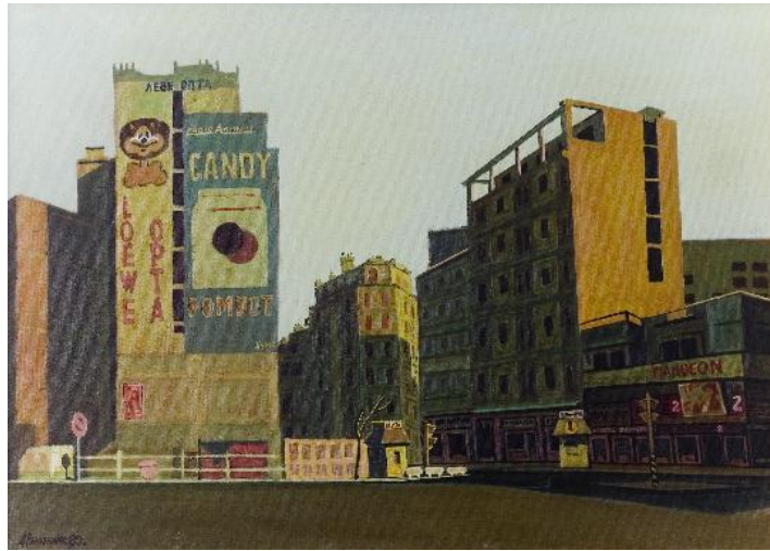
Οδός Δωδεκανήσου, Λουκάς Βενετούλιας (1980), Συλλογή Δημοτικής Πινακοθήκης Θεσσαλονίκης

«...Κάποια μέρα, στα τελευταία κι ολοσκότεινα καθίσματα του Πάνθεον, είδα δυο που ξεβρακώθηκαν και τραβούσαν τα πουλιά τους. ‘Τί αηδία’, είπα· κι εννοούσα πιο πολύ τον εαυτό μου, που έρεπα και σερνόμουν προς τα χυδαία...».