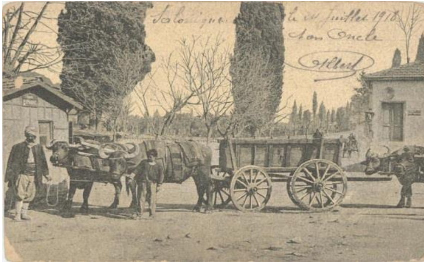
Τούρκος μεταφορέας στην οδό Ειρήνης

«...Μετά τη λαχαναγορά άφησαν τη σούστα με τη φοράδα πίσω από τη Ραμόνα, σ' ένα φαναρτζή και βγήκαν σουλάτσο. Λίγο ψώνιζαν, περισσότερο ρωτούσαν και μασούσαν πασατέμπο και σταφιδόψωμο, με το οποίο τους είχε γεμίσει τις τσέπες το πρωί. Περιπάτησαν όλη την οδό Γιαννιτών με τα ζωμπορικά και τα πατσατζίδικα, βγήκαν στον Βαρδάρη, που ήταν γεμάτος λασπουριά από τις τελευταίες βροχές, και πήραν την Εγνατία με τις βιτρίνες, πολύ λίγο όμως, γιατί είδαν πάνω τους τον ουρανό να βαραίνει πάλι και να γίνεται σκέτο μολύβι. Πέρασαν απ' του Ζωγράφου, ψώνισαν κι ύστερα βιαστικά τράβηξαν πάλι για τη Ραμόνα, για να πάρουν τη σούστα και να φύγουν...».