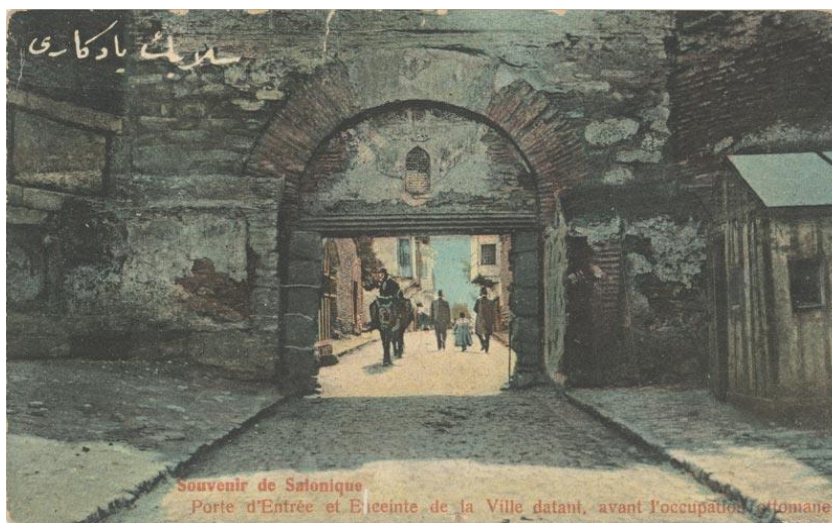
Ληταία Πύλη – Αρχείο Κέντρου Ιστορίας Θεσσαλονίκης

«...Παλιότερα, στα δυτικά τείχη, επάνω από τη ‘Ληταία’ πύλη, υπήρχε σε μαρμάρινη πλάκα, μια χάραξη στη γλώσσα τους, σχετική μ’ αυτό το κούρσεμα της πόλεως μας: Ενώ κοιμόταν ο Μουράτ στο παλάτι του στα Γιαννιτσά, παρουσιάστηκε στον ύπνο του ο Θεός και του έδωσε να μυρίσει ένα γεμάτο ευωδιά ωραίο τριαντάφυλλο. Τόσο θαμπώθηκε ο σουλτάνος από την ομορφιά του, ώστε θερμοπαρακάλεσε το Θεό να του το δώσει. Και ο Θεός του απάντησε: Το τριαντάφυλλο αυτό, Μουράτ, είναι η Θεσσαλονίκη. Γνώρισε ότι σου είναι δοσμένο από τον ουρανό να το απολαύσεις. Μη χάνεις τον καιρό σου και πήγαινε να το πάρεις. Στην προτροπή αυτή του Θεού υπακούοντας ο Μουράτ, βάδισε εναντίον της Θεσσαλονίκης, και καθώς ήταν γραμμένο, την κυρίεψε...».