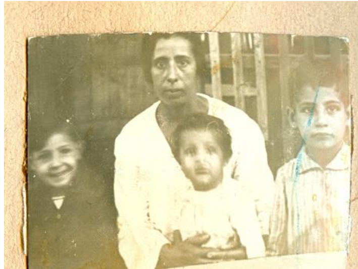
Οικογένεια εβραίων στη συνοικία Ρεζή Βαρδάρ